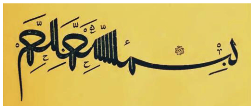
تصویر ۱ - بسمله به خط مسلسل اثر احمد قره‌حصاری (رساله خط و خطاطان، ص ۸۶)

بخش چهارم، مشتمل بر معرفی و شرح حال خوش‌نویسان خطوط ثلث و نسخ در قلمرو عثمانی است. در آغاز این بخش، ابتدا به معرفی هفت استاد بزرگ آناتولی یا «اساتید سبعة روم» — که نخستین خطاطان آن دیار و بنیان‌گذاران مکتب خوشنویسی عثمانی‌اند — پرداخته شده است که عبارت‌اند از: شیخ حمدالله آماسی، مصطفی دده، عبدالله آماسی، محی‌الدین آماسی، اسحاق جمال‌الدین، احمد قره‌حصاری و شربتچی‌زاده ابراهیم بورسوی. در پایان این قسمت کوتاه، تصویری از «بسمله» به خط مسلسل اثر احمد قره‌حصاری درج شده که تنها تصویر موجود در این رساله است (تصویر ۱). در این بخش، مانند بخش سوم، شرح حال خوشنویسان خطوط ثلث و نسخ دوره عثمانی ذکر و مدخل‌های آن بر اساس ترتیب حروف الفبا تنظیم شده است. در انتهای بخش چهارم، معرفی ۷ تن از خطاطان مربوط به این دوره که تاریخ وفاتشان مشخص نبوده، آمده و در ادامه آن، نام ۱۵ تن از خطاطان معاصر نویسنده که در تاریخ تحریر رساله در قید حیات بوده‌اند ذکر و در یکی دو سطر معرفی شده است. با احتساب این دو قسمت اخیر، در مجموع، ۳۰۱ مدخل در این بخش موجود است. علت فراوانی مدخل‌های این بخش را باید در رواج و گسترش فراگیر خطوط ثلث و نسخ در عثمانی جستجو کرد؛ البته دسترسی نداشتن نویسنده به منابع و تذکره‌های ایرانی نیز موجب شده تا تعداد خوشنویسان ایرانی در ثلث و نسخ از خطاطان عثمانی کمتر باشد.