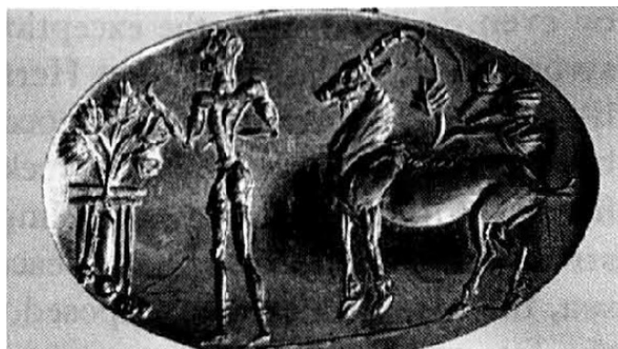
تصویر شماره ۳: ایزد جوان با درخت و بز همراه با گیاهان روئیده بر پشت او، مهر میسین متعلق به ۱۵۰۰ پیش از میلاد.

گیاهان در این تصویر از پشت دو گاو نر جوان روئیده، و مابین آن دو گیاهی نیز از درون بذر روی زمین بالیده است. این تصویر نمادی است از نیروی حیات که به شکل دانه روئیده و تصور باززایی گیاه از درون گاو نر را نشان می‌دهد (Gimbutas 1993: 129). یا تصویر نقش شده بر مهری از میسین ۱ که ایزد جوانی در سمت چپ خود درخت زندگی را روئیده در محراب لمس می‌کند (تصویر شماره ۳).