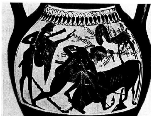
تصویر شماره ۴: نقاشی بر گلدانی یونانی (۵۳۰-۵۱۰ پیش از میلاد)، هرکول در حال کشتن گاو کرتی.

پشت او بز شاخ‌داری است که درختی همانند درخت زندگی از پشتش روییده است؛ درست مانند رویدن گیاه از پشت گاو در مَهری که در بالا شرح داده شد. نیز در تصویری که بعدها روی گلدانی (۵۳۰-۵۱۰ پیش از میلاد) از هرکول به همراه گاو کرتی نقش شده (تصویر شماره ۴) و از بدن گاو گیاه روییده است. تصاویری که به یک سنت مستمر اشاره دارد و نشان‌دهنده آن است که اصل حیات مجدد که پیش از این به ایزدبانوی دوجنسی تعلق داشته، بعد کاملاً در حیوان نر و ایزد نر جوان تجلی یافته است (Ibid: 135).