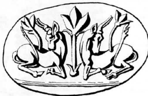
تصویر شماره ۲: گیاهان روئیده از پشت گاوهای نر، همراه با گیاه برآمده از بذر در میان آنها؛ حک شده بر حلقه کریستالی، متعلق به ۱۵۰۰ پیش از میلاد در میسین.

گیاهان در این تصویر از پشت دو گاو نر جوان روئیده، و مابین آن دو گیاهی نیز از درون بذر روی زمین بالیده است. این تصویر نمادی است از نیروی حیات که به شکل دانه روئیده و تصور باززایی گیاه از درون گاو نر را نشان می‌دهد (Gimbutas 1993: 129). یا تصویر نقش شده بر مهری از میسین ۱ که ایزد جوانی در سمت چپ خود درخت زندگی را روئیده در محراب لمس می‌کند (تصویر شماره ۳).